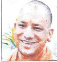
13 को 1150 महिलाओं को मुफ्त दी जाएगी सिलाई मशीन

उन्होंने बताया कि महाराणा प्रताप शिक्षा परिषद के तत्वावधान में निशुल्क सिलाई-कढ़ाई प्रशिक्षण का कार्यक्रम सिंगर इंडिया लिमिटेड के सहयोग से पूर्ण हुआ है। प्रशिक्षण लेने वाली महिलाओं को सिंगर इंडिया लिमिटेड ने एक माह मुफ्त ऑनलाइन प्रशिक्षण का कूपन भी दिया है। प्रशिक्षण प्राप्त महिलाओं को जेके ग्रुप की तरफ से मुफ्त सिलाई मशीन उपलब्ध होने के बाद प्रशासन के सहयोग से सरकार की रोजगार और स्वरोजगार की योजनाओं से भी जोड़ा जाएगा।