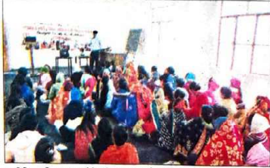
एमपी शिक्षा परिषद द्वारा आयोजित नि:शुल्क सिलाई-कढ़ाई प्रशिक्षण केंद्र।