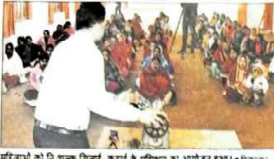
महिलाओं को निःशुल्क सिलाई-कढ़ाई के प्रशिक्षण का आयोजन हुआ।

गोरखपुर, निज संवाददाता। महिलाओं को आर्थिक रूप से बचाने की दिशा में महाराणा प्रताप शिक्षा परिषद की नई पहल से चार केंद्रों के अंतर्गत 12 स्थानों पर कुल 1150 महिलाओं के लिए निःशुल्क सिलाई-कढ़ाई के प्रशिक्षण का कार्यक्रम बुधवार से शुरू हो गया। सात दिवसीय प्रशिक्षण के बाद उन्हें मुफ्त सिलाई मशीन वितरित की जाएगी। प्रशिक्षण का यह कार्यक्रम जेके अर्बनसेसप डेवेलपर्स लिमिटेड कानपुर द्वारा प्रायोजित है और सिगर इंडिया लिमिटेड के सहयोग से किया जा रहा है। प्रशिक्षण का औपचारिक