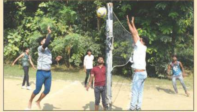
महाविद्यालय के वार्षिक महोत्सव के अन्तर्गत आयोजित वॉलीबाल प्रतियोगिता में प्रतिभाग करते छात्र