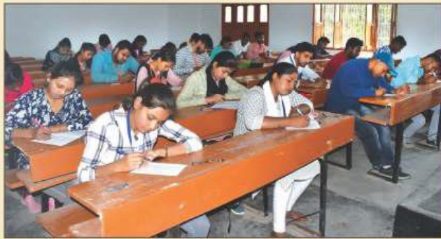
महाविद्यालय के वार्षिक महोत्सव के अन्तर्गत आयोजित सामान्य ज्ञान प्रतियोगिता में प्रतिभाग करते विद्यार्थी