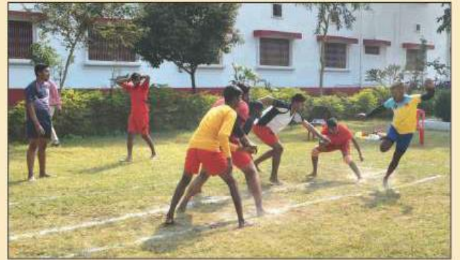
महाविद्यालय के वार्षिक महोत्सव के अन्तर्गत आयोजित कबड्डी प्रतियोगिता में प्रतिभाग करते छात्र