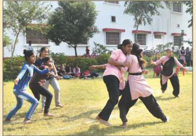
महाविद्यालय के वार्षिक महोत्सव के अन्तर्गत आयोजित कबड्डी प्रतियोगिता में प्रतिभाग करती छात्राएं