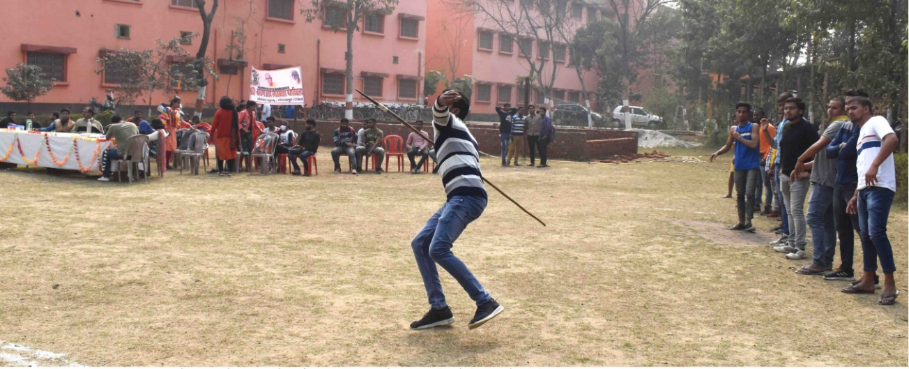
खेल महोत्सव के दौरान भाला क्षेपण प्रतियोगिता में प्रतिभाग करता खिलाड़ी