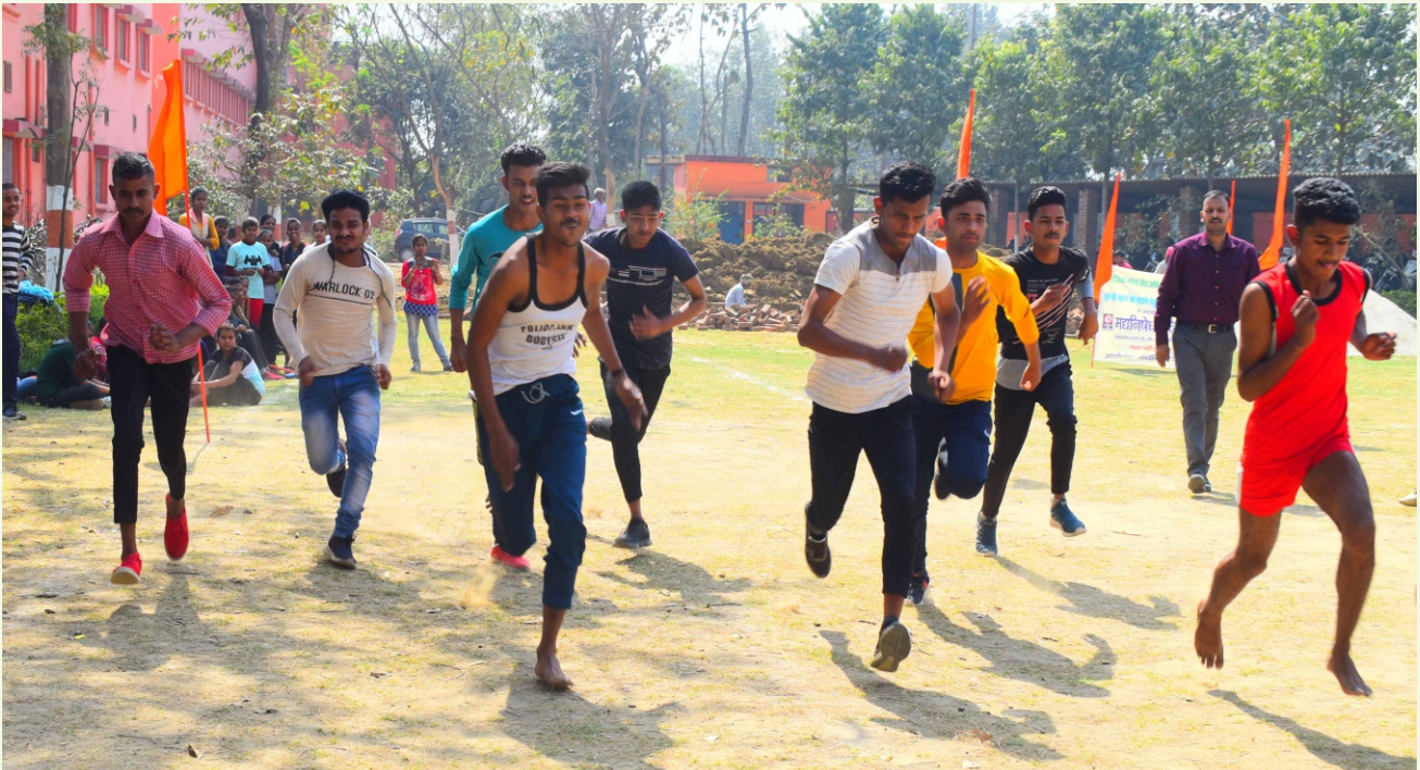
800 मीटर दौड़ (बालक वर्ग) प्रतियोगिता में प्रतिभाग करते छात्र