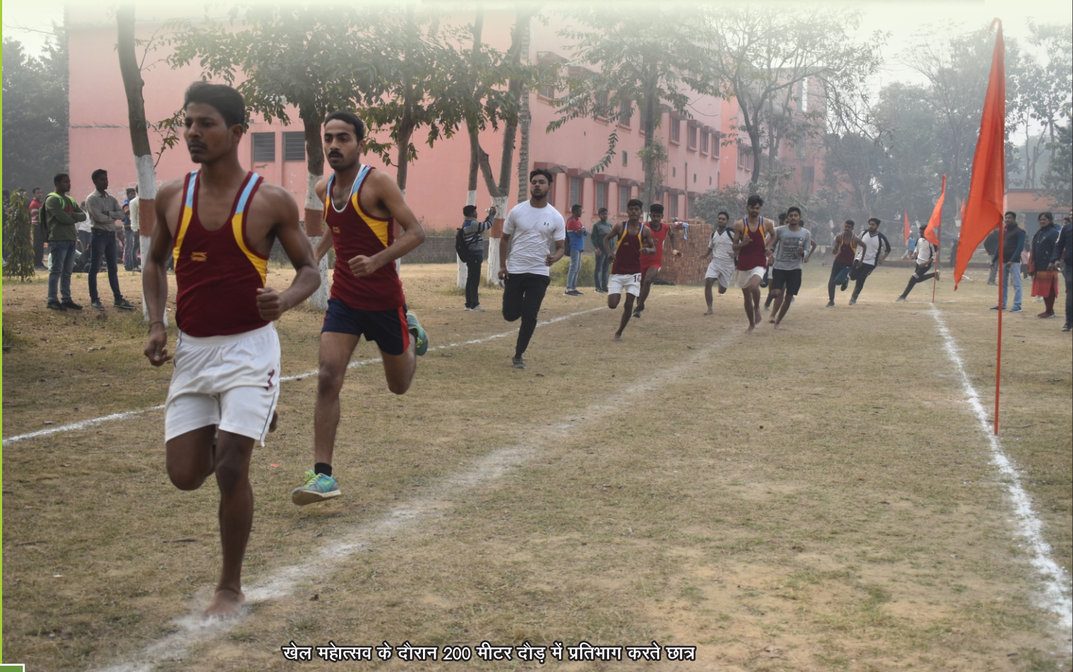
खेल महोत्सव के दौरान 200 मीटर दौड़ में प्रतिभाग करते छात्र