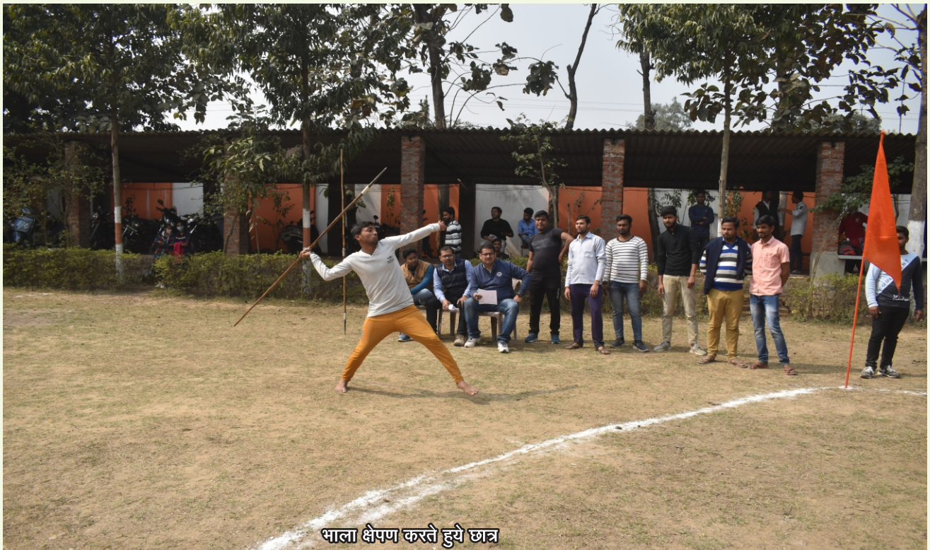
भाला क्षेपण करते हुये छात्र