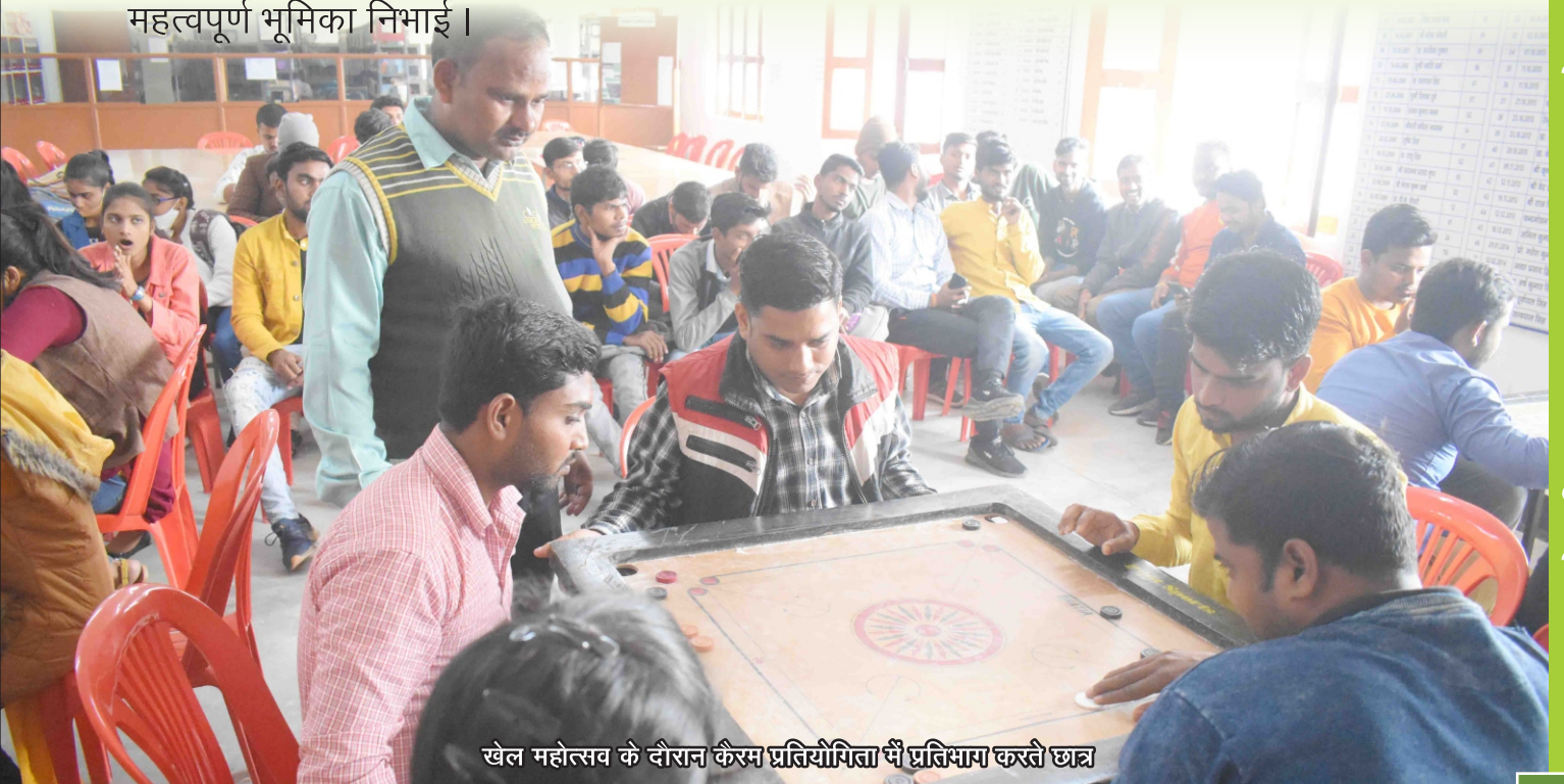
खेल महोत्सव के दौरान कैरम प्रतियोगिता में प्रतिभाग करते छात्र