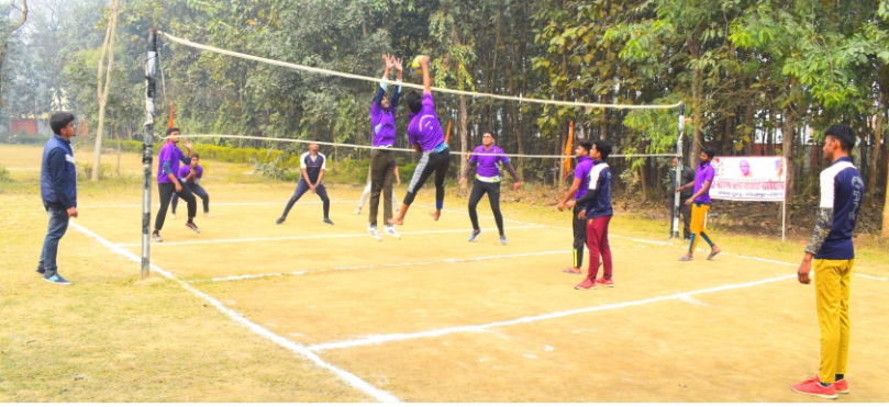
खेल महोत्सव के दौरान वालीबॉल खेल प्रतियोगिता में प्रतिभाग करते विद्यार्थी

इस प्रतियोगिता में बालक वर्ग में कुल 04 टीमों ने प्रतिभाग किया। प्रथम मुकाबला महाराणा प्रताप टीम एवं गुरुगोरक्षनाथ टीम के बीच हुआ, जिसमें सीधे सेटों में 7-25 एवं 18-25 के स्कोर से गुरु गोरक्षनाथ टीम विजयी रही। दूसरा मुकाबला योगिराज बाबा गम्भीरनाथ सेवाश्रम टीम एवं छात्रसंघ टीम के बीच हुआ, जिसमें सीधे सेटों में 17-25 एवं 11-25 के स्कोर से योगिराज बाबा गम्भीरनाथ सेवाश्रम विजयी रही।