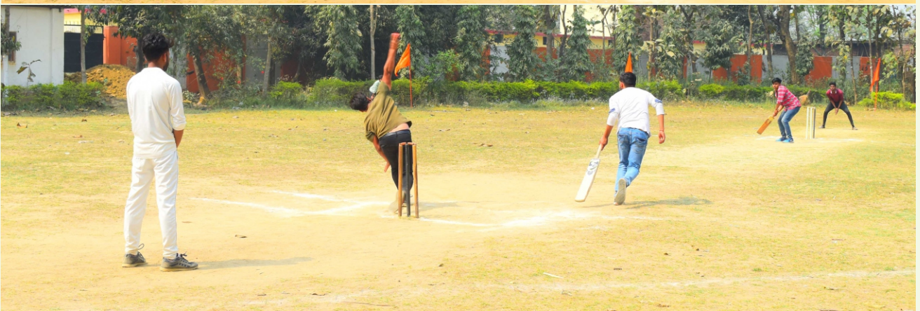
महन्त अवेद्यनाथ स्मृति कैनवस बाल प्रतियोगिता में प्रतिभाग करते खिलाड़ी