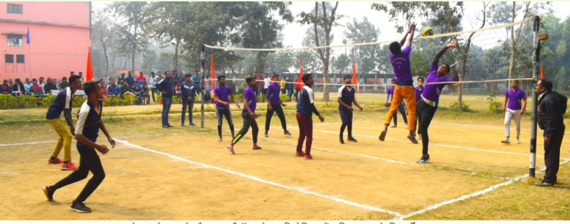
खेल महोत्सव के दौरान वालीबॉल खेल प्रतियोगिता में प्रतिभाग करते विद्यार्थी