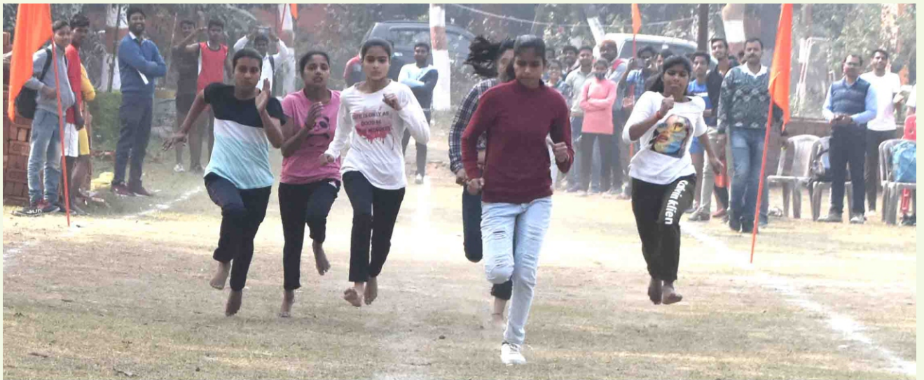
खेल महोत्सव के दौरान 100मीटर दौड़ प्रतियोगिता में प्रतिभाग करतीं खिलाड़ी