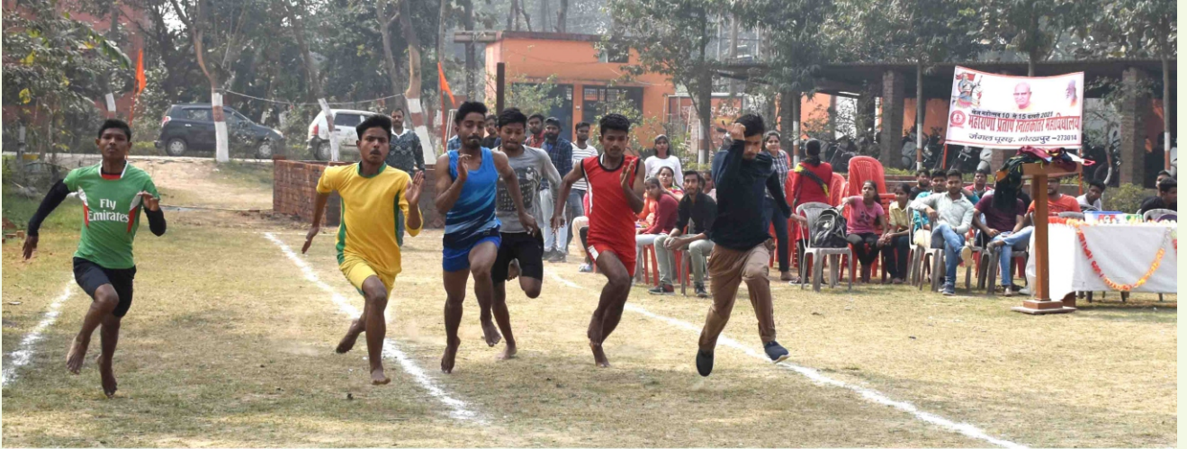
खेल महोत्सव के दौरान 100मीटर दौड़ प्रतियोगिता में प्रतिभाग करते खिलाड़ी