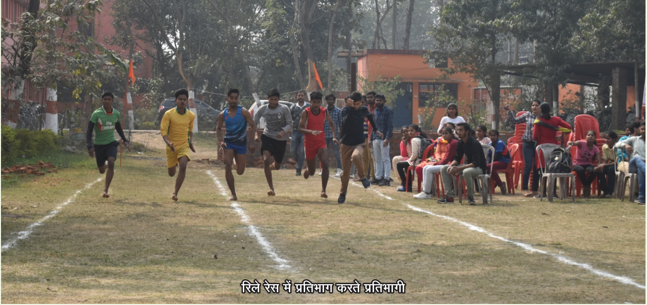
रिले रेस में प्रतिभाग करते प्रतिभागी

4X100 मीटर रिले रेस प्रतियोगिता के पुरुष वर्ग में योगिराज बाबा गम्भीरनाथ टीम ने प्रथम, दिग्विजयनाथ टीम ने द्वितीय तथा छत्रपति शिवाजी टीम ने तृतीय स्थान प्राप्त किया। 4X100 मीटर