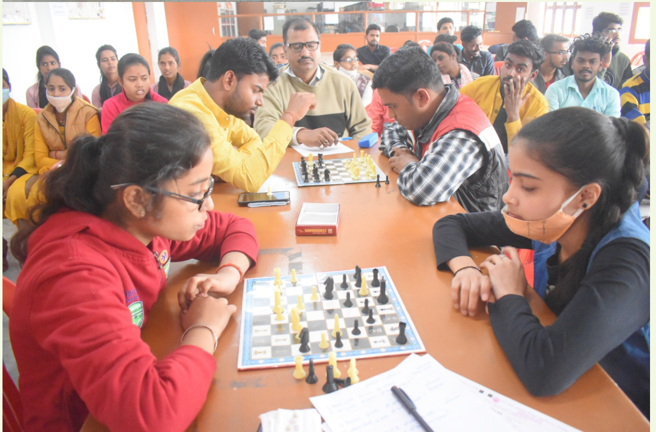
खेल महोत्सव के दौरान शतरंज प्रतियोगिता