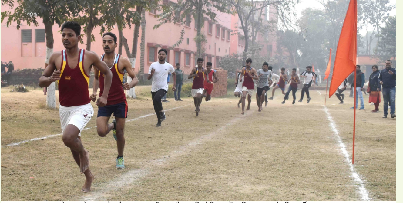
खेल महोत्सव के दौरान 800 मीटर दौड़ प्रतियोगिता में प्रतिभाग करते विद्यार्थी