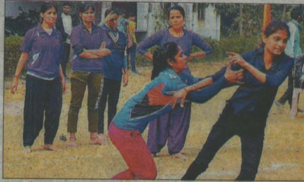
एमपी पीजी कॉलेज में कबड्डी स्पर्धा में भाग लेती प्रतिभागी।

महाराणा प्रताप पीजी कॉलेज, जंगल धूसड़ के वार्षिक महोत्सव के तहत आयोजित राष्ट्रीय सेवा योजना के सात दिवसीय शिविर के तीसरे दिन 'वैश्विक महामारी कोविड-19 के दौरान आपदा को अवसर में बदलता भारत' विषय पर बौद्धिक सत्र का आयोजन किया गया। वनस्पति विज्ञान के