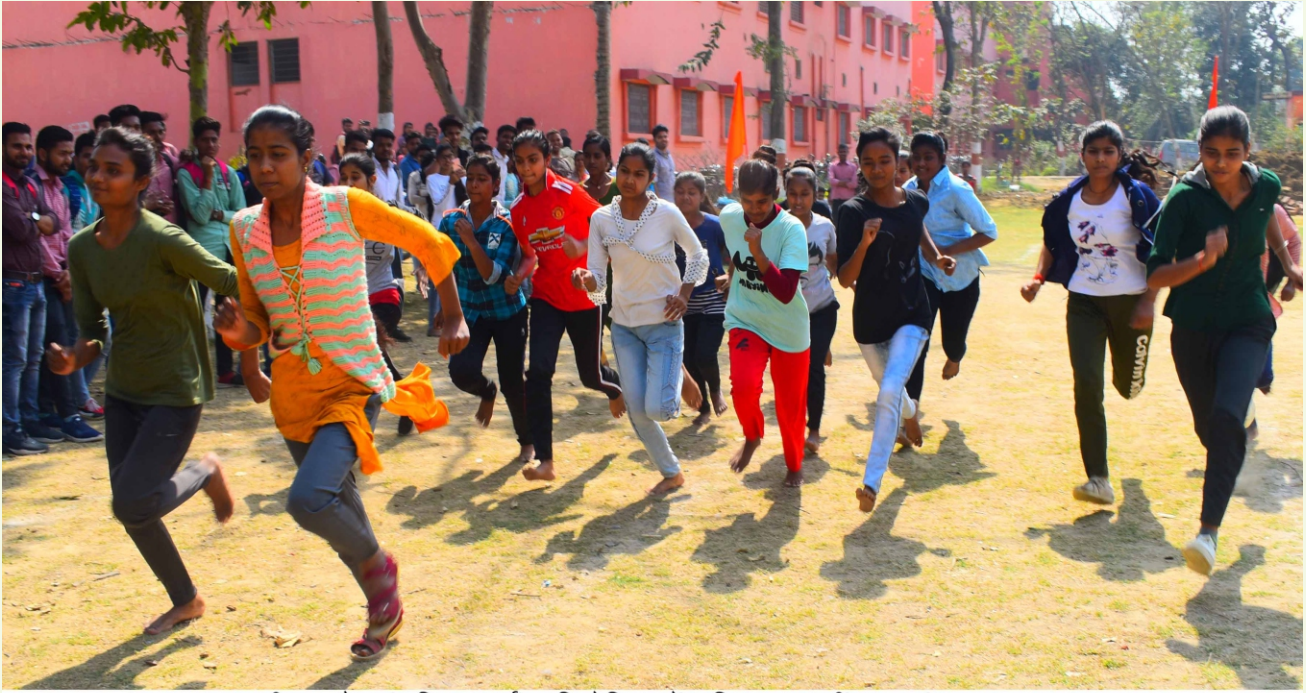
800 मीटर दौड़ (बालिका वर्ग) प्रतियोगिता में प्रतिभाग करती छात्राएं