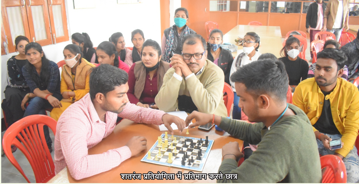
शतरंज प्रतियोगिता में प्रतिभाग करते छात्र

खेल महोत्सव के अन्तर्गत 14 फरवरी, 2021 को महन्त अवेद्यनाथ शतरंज प्रतियोगिता का आयोजन किया गया। इस प्रतियोगिता का शुभारम्भ गृहविज्ञान विभाग की सहायक आचार्य सुश्री