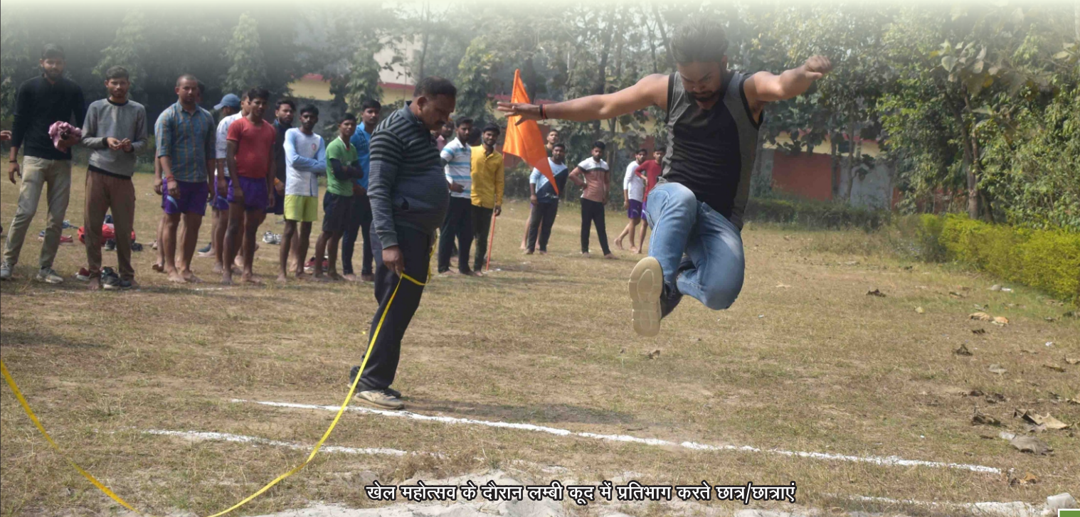
खेल महोत्सव के दौरान लम्बी कूद में प्रतिभाग करते छात्र/छात्राएं