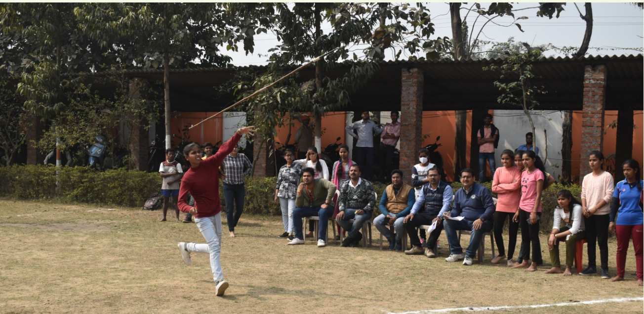
भाला क्षेपण प्रतियोगिता में प्रतिभाग करती छात्राएं