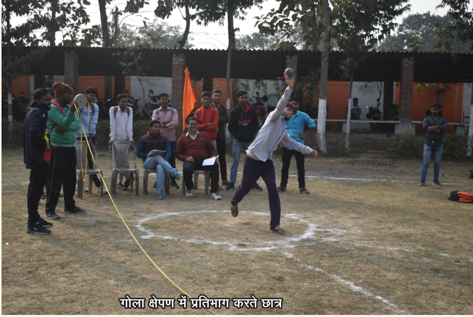
गोला क्षेपण में प्रतिभाग करते छात्र