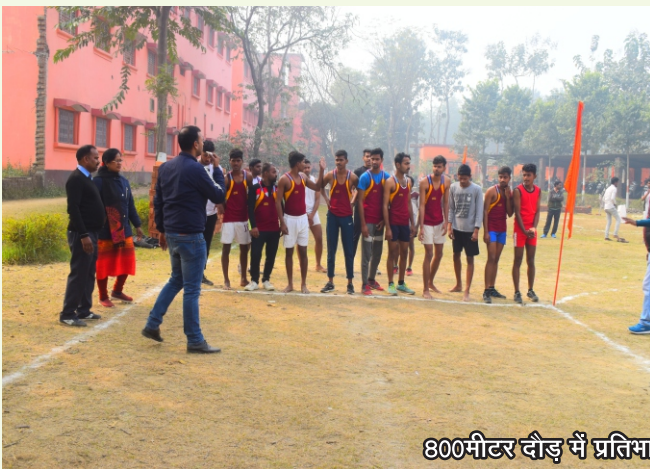
800मीटर दौड़ में प्रतिभाग करते हुये छात्र/छात्राएं