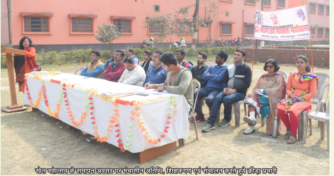
खेल महोत्सव के समापन अवसर पर मंचासीन अतिथि, शिक्षकगण एवं संचालन करते हुये क्रीड़ा प्रभारी